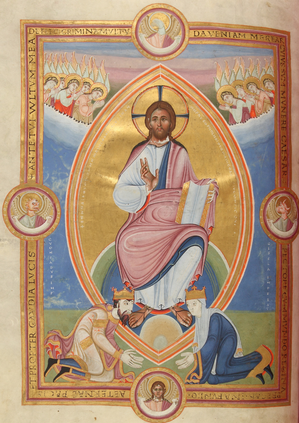
Codex Aureus Spirensis oder Codex Aureus Escorialiensis . El Escorial, Real Biblioteca, Cod. Vitrinas 17

Vollständiges Digitalisat abrufbar unter: